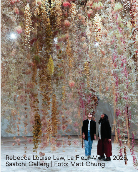
Rebecca Louise Law, La Fleur-Me, 2025, Saatchi Gallery