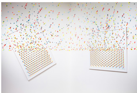
Anarchy on the horizon