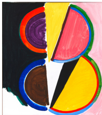
Originating 2023 Olie op doek 45 x 40 cm