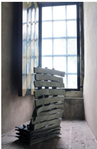
Luxaflex 2023 Keramiek 70 x 40 x 39 cm