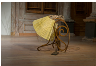
Open me Close Me 2022

Gevonden hout, grafiet op 120g gerecycled papier, bijenwas, rotan, gesmeed staal 89 x 82 x 110 cm