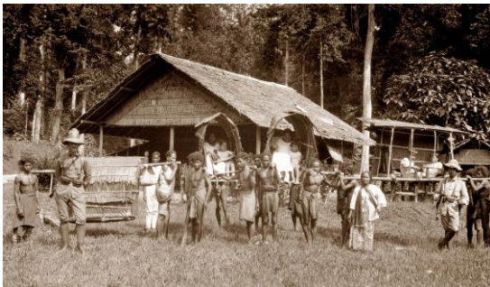
05 – De Millenaars verhuizen van Seram naar Ambon, 1925