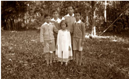
10 – Warme kleding, ter voorbereiding op het vertrek naar Nederland, Depok, 1932